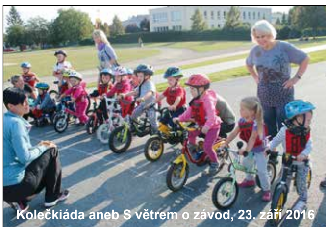
Kolečkiáda aneb S větrem o závod, 23. září 2016