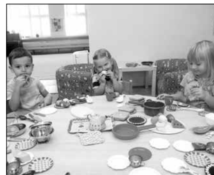
Hrajeme si v Beruškách