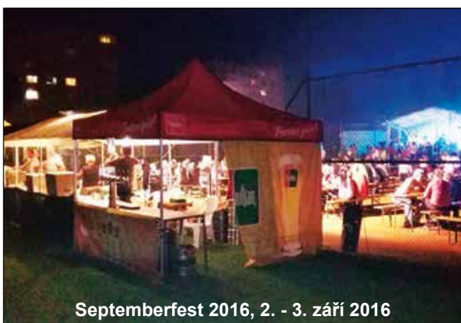
Septemberfest 2016, 2. - 3. září 2016