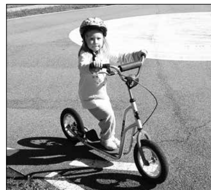
Dopravní hřiště v Kroměříži