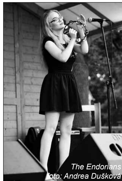
The Endorians

Řekl bych, že ano. Vždy je co zlepšovat a my už teď pár námětů máme, ale domnívám se, že nic zásadního jsme nepokazili. Pohostili jsme za celý víkend, považte, bez mála tisíc návštěvníků! To je přece nádherný start. Nabídli jsme 28 druhů piv z osmi pivovarů, zejména díky našim přátelům z řad podnikatelů a obětavosti amatérských kuchařů jsme návštěvníky odzbrojili specialitami z grilu, udírny a zejména ze zvěřiny. Po prav-