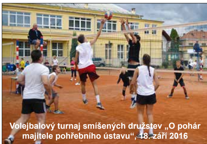
Volejbalový turnaj smíšených družstev „O pohár majitele pohřebního ústavu“, 18. září 2016