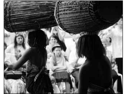
Soubor bicích nástrojů ZUŠ v Sala Terreně kroměřížském zámku; Ugandan Dancers Band