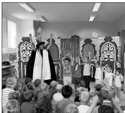
Divadelní pohádka „Královna a drak“