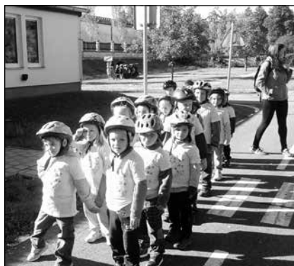
Dopravní hřiště v Kroměříži