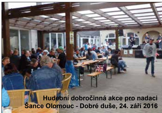
Hudební dobročinná akce pro nadaci Šance Olomouc - Dobré duše, 24. září 2016