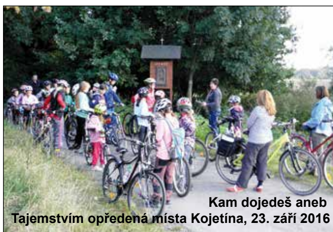
Kam dojedeš aneb Tajemstvím opředená místa Kojetína, 23. září 2016