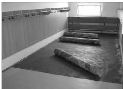
Stržení staré podlahy v šatně