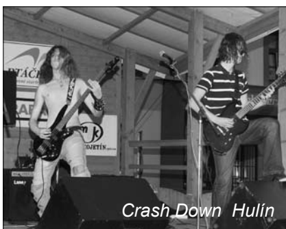
Crash Down Hulín