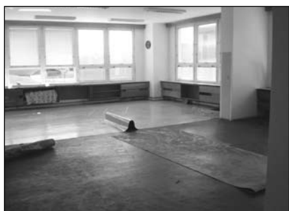
Stržení staré podlahy ve třídě