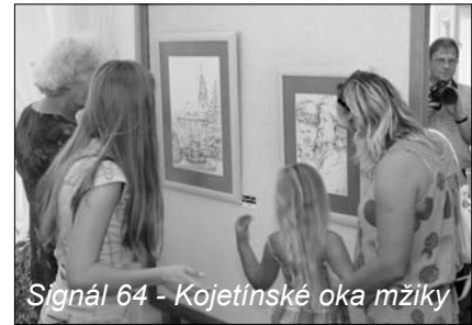
Signál 64 - Kojetínské oka mžiky