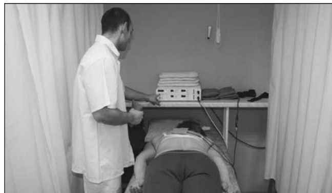
Průběh elektroterapije v RELAX CENTRU Kojetín

Elektroterapije napomáhá k urychlení vstřebání otoků, hematomů a je velmi prospěšná pro růst svalů, pohyblivost kloubů a svalové křeče.