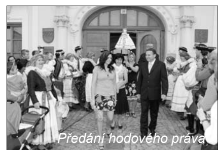
Předání hodového práva