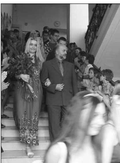
9. B odchází