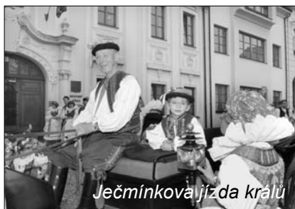
Ječmínková jízda králů