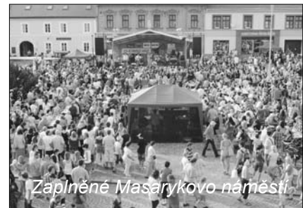
Zaplňené Masarykovo náměstí