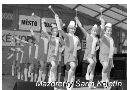
Mazoretky Šarm Kojetín