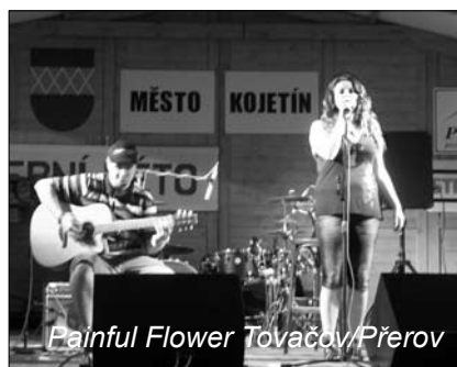
Painful Flower Tovačov/Přešov