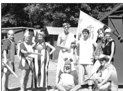
LT Asterix a Obelix