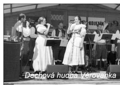
Dechová hudba Věrovanka