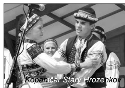
Kopaničár Starý Hrozenkov