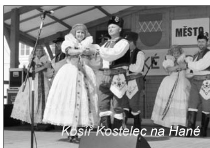
Košič Kostelec na Hané