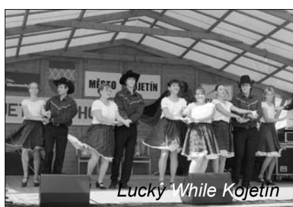
Lucky White Kojetín