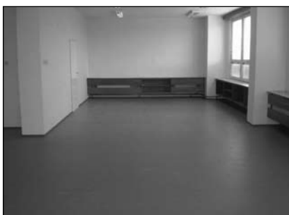
Nová podlaha ve třídě