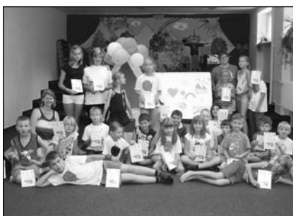
LPT Vzhůru do oblak