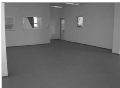
Nová podlaha ve třídě