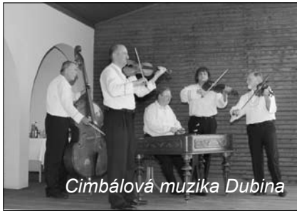
Cimbálová muzika Dubina