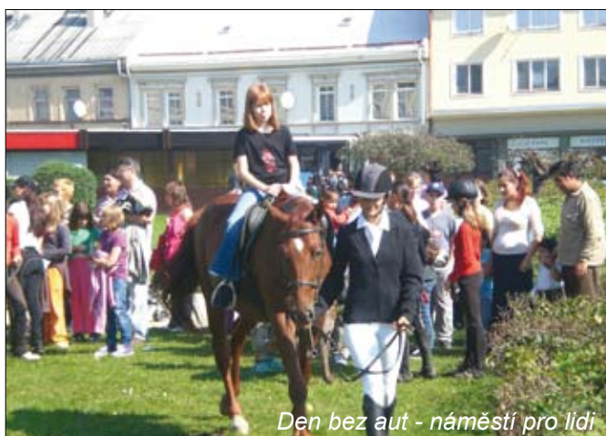
Den bez aut - náměstí pro lidi