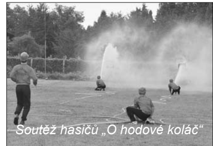
Soutěž hasičů „O hodové koláč“