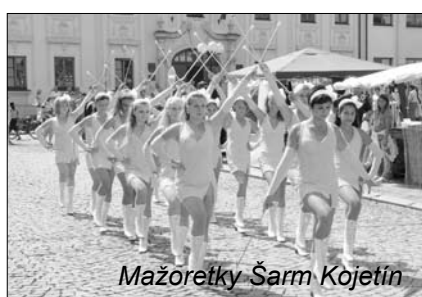
Mažoretky Šarm Kojetín