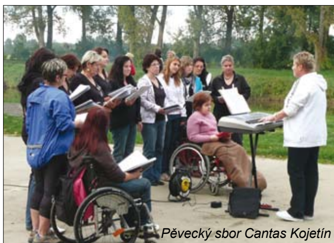
Pěvecký sbor Cantas Kojetín