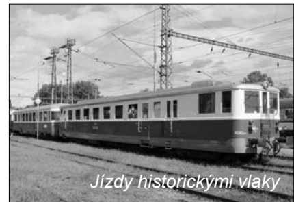
Jízdy historickými vlaky