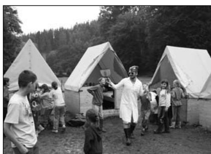
LT Asterix a Obelix