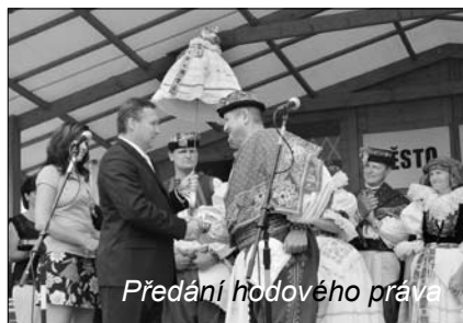
Předání hodového práva

město kojetín MĚSTO KOJETÍN MĚSTO KOJETÍN