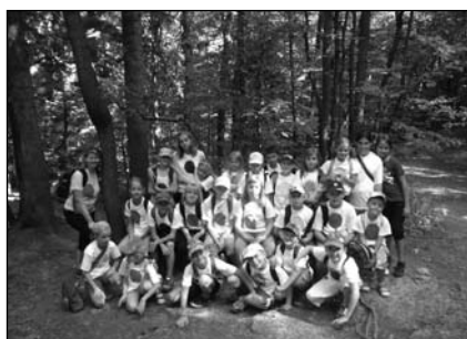
LPT Vzhůru do oblak