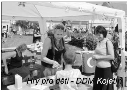
Hry pro děti - DDM Kojetín