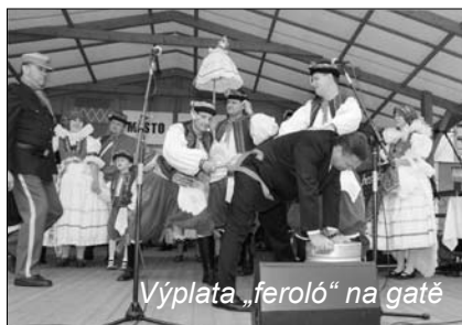
Výplata „feroló“ na gatě