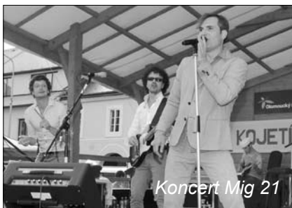
Koncert Mig 21