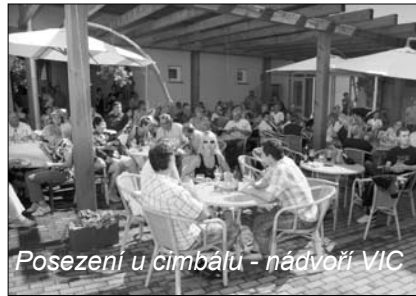
Posezení u cimbálu - nádvoří VIC