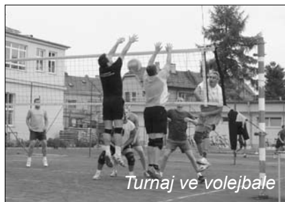
Turnaj ve volejbale