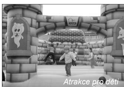
Atrakce pro děti