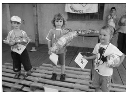
Olympijské hry v Křenovicích