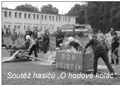
Soutěž hasičů „O hodové koláč“