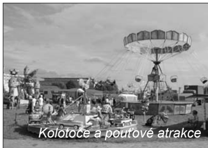
Kolotoče a pouťové atrakce