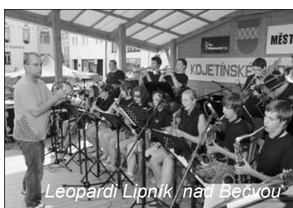
Leopardi Lipník nad Bečvou