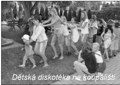
Dětská diskotéka na koupališti

město Kojetín MĚSTO KOLENČICKÝCH TU 614 02 KOLENČICKÝCH TU 614 02