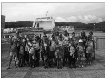
LPT U nás v Kocourkově