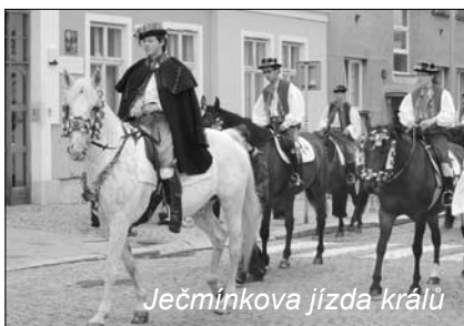
Ječmínková jízda králů