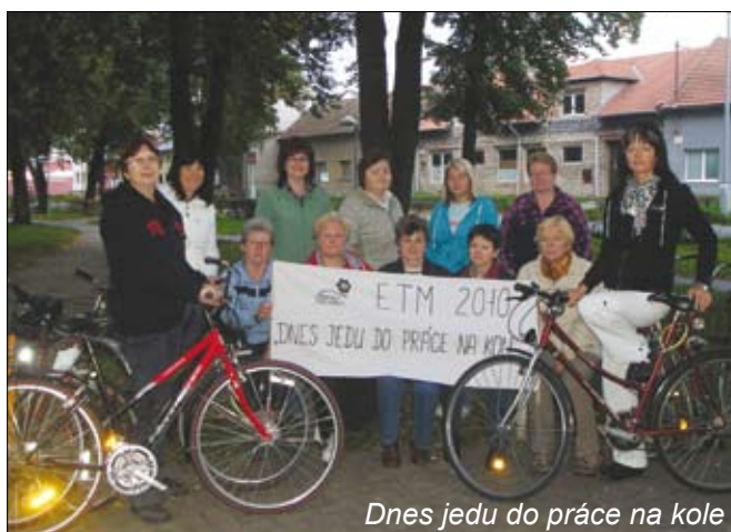
Dnes jedu do práce na kole