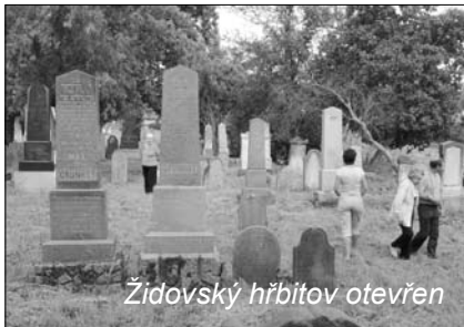
Židovský hřbitov otevřen