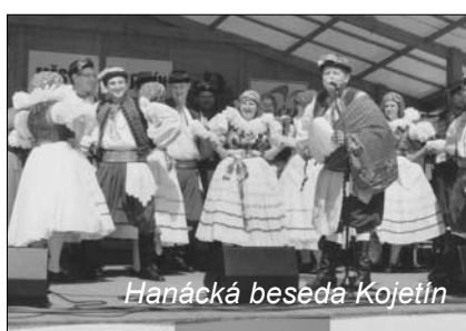
Hanácká beseda Kojetín