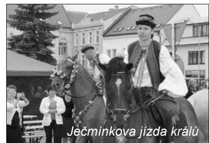
Ječmínková jízda králů