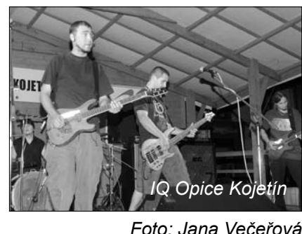
IQ Opice Kojetín