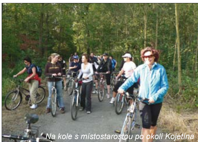
Na kole s místostarostou po okolí Kojetína