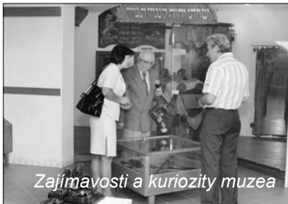
Zajímavosti a kuriozity muzea