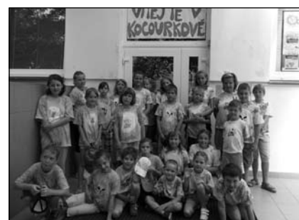
LPT U nás v Kocourkově