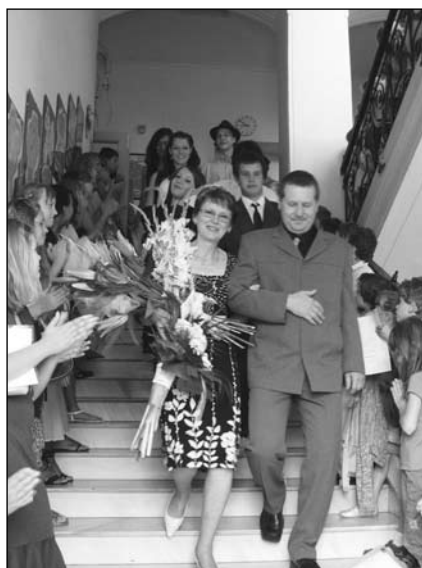
9. A odchází

Závěrem bychom rádi poděkovali za dosavadní podporu a spolupráci našim partnerům - Městu Kojetín, Domu dětí a mládeže Kojetín, Městskému kulturnímu středisku Kojetín i všem ostatním - často neznámým. Na dokreslení přinášíme několik záběrů z konce minulého školního roku.