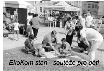
EkoKom stan - soutěže pro děti