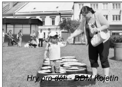
Hry pro děti - DDM Kojetín