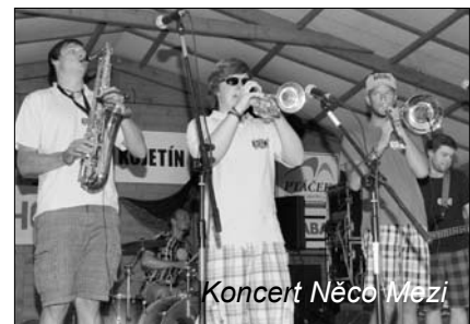
Koncert Něco Mězi