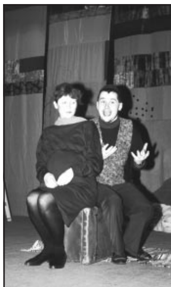
Pohádka o statečné princezně Máně