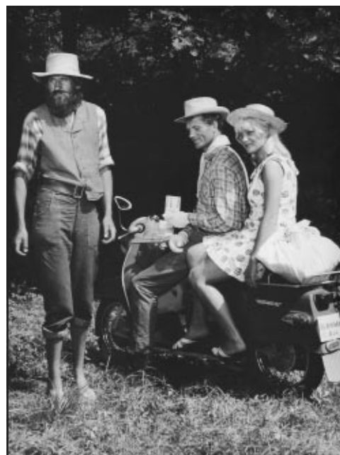
Z nejpůvodnějšího filmu „BONYBOY“

VEDOUCÍ TVŮRČÍ SKUPINY „SIGNÁL 64“, FOTOGRAF, REŽISÉR, KAMERAMAN KRESBY, AKVARELY, OLEJE KRESBY, AKVARELY, PASTELY, VÝTVARNÁ ARCHITEKTURA OLEJE - KRAJINOMALBA, ZÁTIŠÍ FOTOGRAFIE - PORTRÉTY, KRAJINY FOTOGRAFIE - ŽIVÁ PŘÍRODA A KRAJINA FOTOGRAFIE-STUDIE STROMŮ, STRUKTURY DŘEVA FOTOGRAFIE - PORTRÉTY, ZÁTIŠÍ FOTOGRAFIE - ZVLÁŠTNÍ TECHNIKY FOTOGRAFIE - ZÁTIŠÍ, KRAJINÁŘSKÉ MOTIVY PEROKRESBY, KRESBA RUDKOU MALBA, FOTOGRAFIE, PLASTIKY KOMBINOVANÉ TECHNIKY KRESBY A MALBY KRESBA TUŽKOU