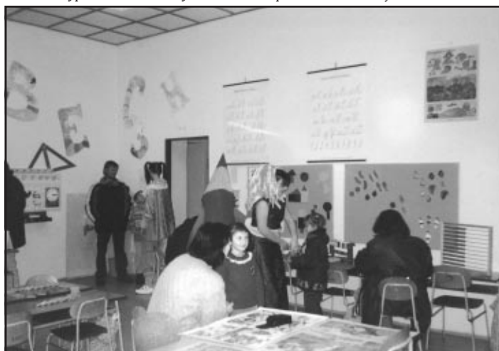
Den otevřených dveří na ZŠ Svatopluka Čecha Kojetín