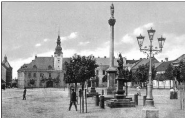
Kojetínské náměstí v roce 1913