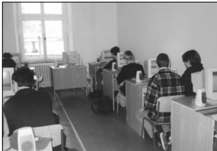
Učebna výpočetní techniky na ZŠ Svatopluka Čecha Kojetín

se dříve unaví). Myslíme si, že teprve při důsledném uplatnění zásad otevřeného partnerství, dobrých vztahů mezi učiteli a žáky, učiteli a rodiči, můžeme žáky vychovávat k vlastnostem jako je úcta, důvěra, snášenlivost, uznání či úcast.