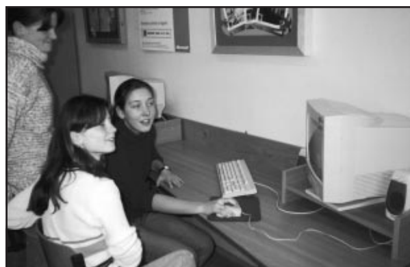
Učebna výpočetní techniky na ZŠ nám. Míru Kojetín