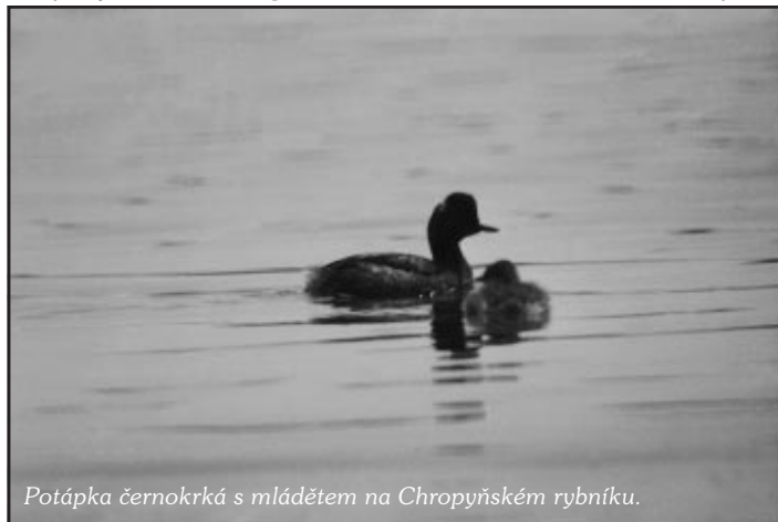
Potápka černokrká s mládětem na Chropynském rybníku.

Brodiví ptáci představují další skupinu řazenou mezi tzv. „vodní ptáky“. Patří mezi ně čápi, volavky, bukači a kvakoši. Mezi veřejností je nejznámějším druhem čáp bílý, symbol příchodu jara i nového života. Je dobře, že na Kojetín-