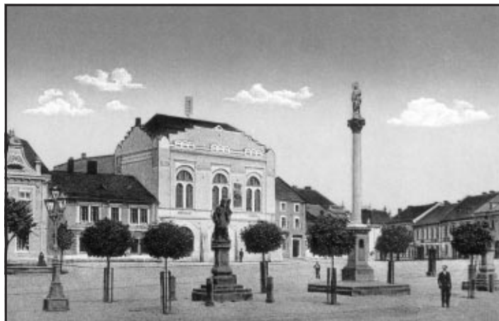
Budova Okresního domu v Kojetíně v roce 1920