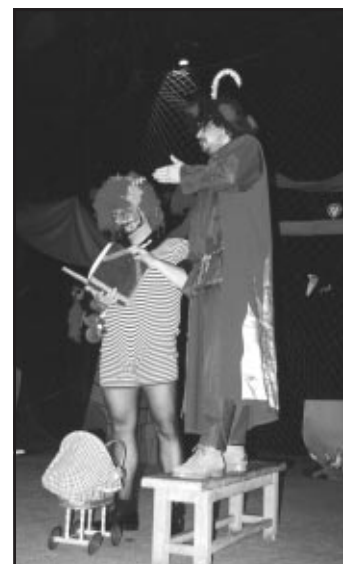
Ze života hmyzu v podání DS T. Miličky Uherský Brod

Přijďte, rádi vás v sále Sokolovny Kojetín uvítáme a věřte, nebudete litovat.