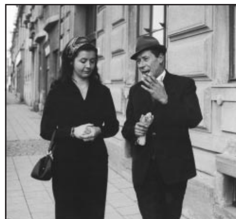
Z filmu „Chtíč“