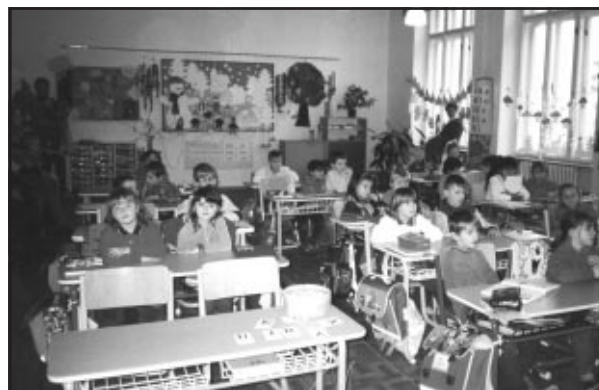
Pohled na prvňáčky v lavicích