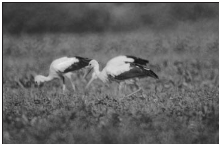
Čápi na loukách u Kojetína

Z dalších druhů brodivých ptáků se na Kojetínsku jen vzácně objeví také další volavkovití ptáci : volavka bílá a červená nebo kvakoš a bukáček. Ti sem zaletí ze svých hnízdišť v jižních oblastech