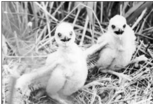
Mláďata motáka pochopa na hnízdě

Skupina ptáků, zařazených do řádů dravci a sovy je z neznalosti často spojována dohromady. Vede k tomu jejich podobná stavba těla, tvar zobáku i hlavní zdroj potravy – lov nejrůznějších živočichů od hmyzu po savce velikosti psa. Tyto společné znaky neznamenají ale příbuznost, jsou výsledkem podobného způsobu života, který dovedl tyto 2 skupiny k vzájemné podobnosti. Tento jev se nazývá konvergence. Dravci a sovy stojí v pomyslné potravní pyramidě na jejím vrcholu, proto jsou nazýváni pre-