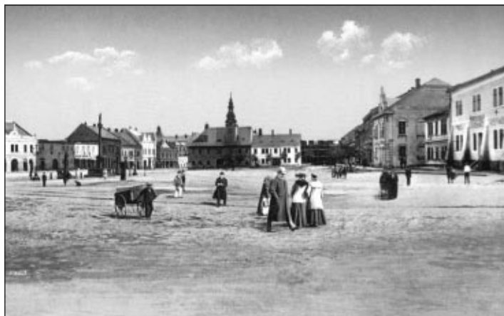
Pohled na kojetínské náměstí v roce 1911