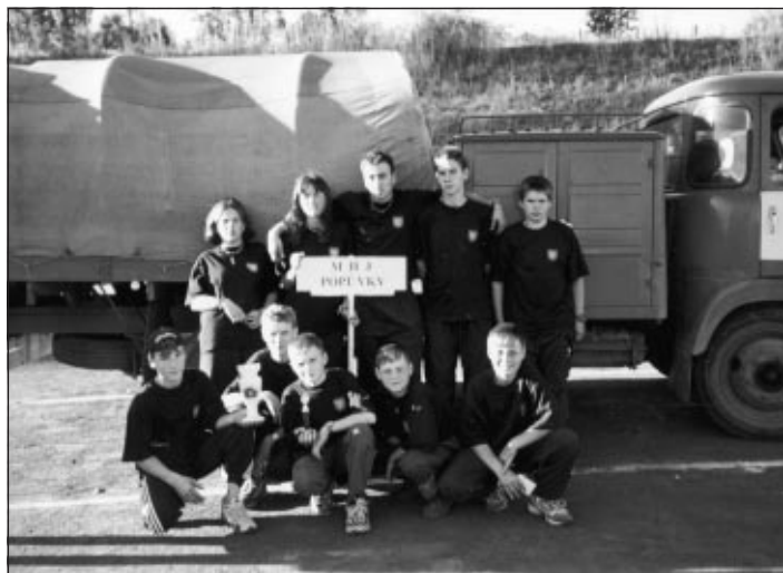
Úspěšné družstvo SDH Popůvky