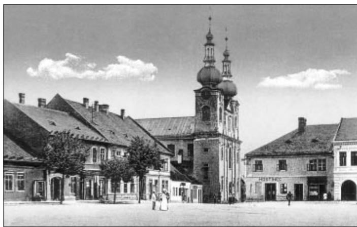
Pohled na kojetínský kostel v roce 1915