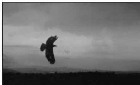
Letící orel sklani

Čerstvě vylétlé mládě kalouse ušatého.