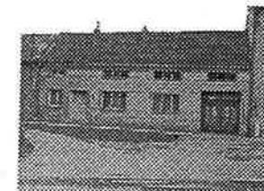
RD 3+1 v Bochoři, obec. Vodovod, kanalizace, elektřina, lokální vytápění, ve dvoře hosp. stavení, stodola, zahrada, vhodné k bydlení s podnikáním.

Stavební pozemky se všemi inženýrskými sítěmi v obcích: Lobodice, Horní Moštěnice, Kokory, Skoky u Staměřic