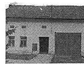
RD 2+1 v Kyselovicích, dvůr, nutné opravy, vlastní studna, elektřina, plyn; vodovod. přípojka před domem.