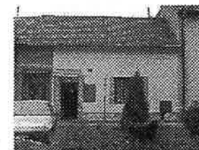
RD 2+1 v Měrovicích, v řadové zástavbě, zahrada. Lokální vytápění, elektřina, voda; plyn před domem.