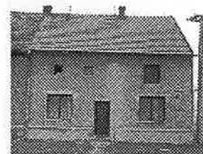
RD 4+1 ve Vikoši se zahradou, dvorkem, nové úpravy: rozvod vody, elektřiny, střecha, okna. Možnost půdní vestavby.