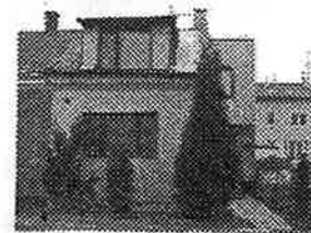
RD 3+1 v Přerově, podsklepený, dvorek, zahárka; plynové vytápění, el. ekřina, voda, kanalizace, telefon.