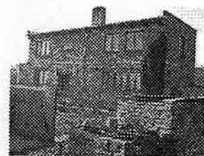
RD 4+1 v Oplocanech s dvorkem a zahradou, podsklepený. El. vytápění, plyn před domem. Rok výstavby 1986.