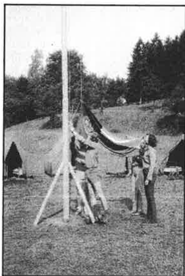
Táborová základna ve Vrážném - vztyčování vlajky (tábor začíná)