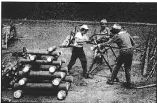
Táborová základna ve Vrážném - příprava táborového ohně