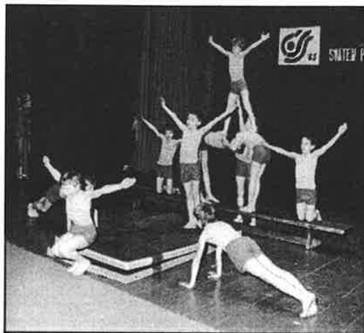
Tělovýchovná akademie 1985 - cvičení mladších žáků