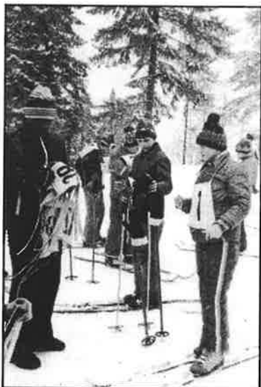
Veřejná lyžařská škola - před závodem