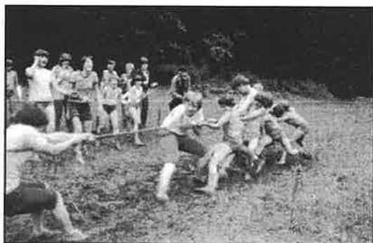
Táborová základna ve Vrážném - boj s lanem i se soupeřem