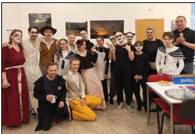
Malá scéna ZUŠ Zlín