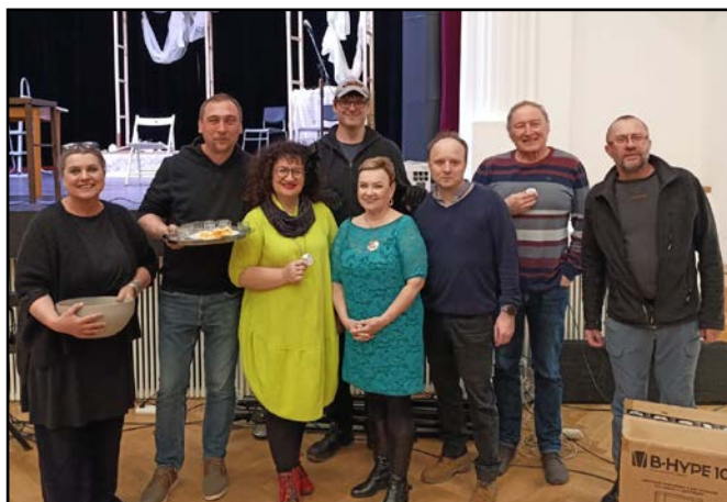
Spurníkův ochotnický soubor Sokola Litovel