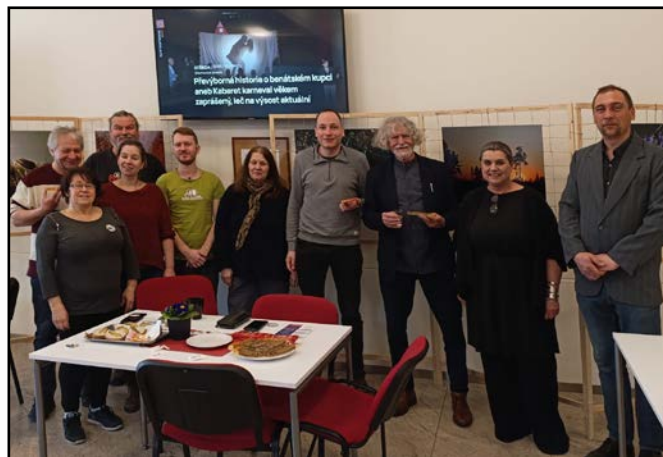
Stará aréna Ostrava