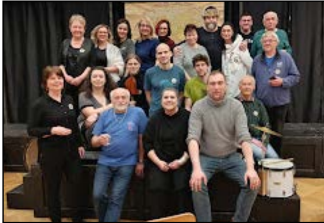
Divadlo Václav Václavov