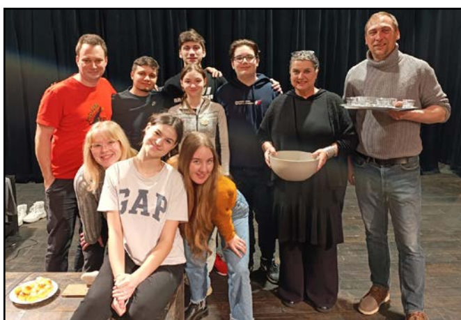
Volné divadlo Zlín