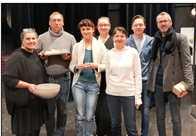
Divadelní spolek Dialog Brno