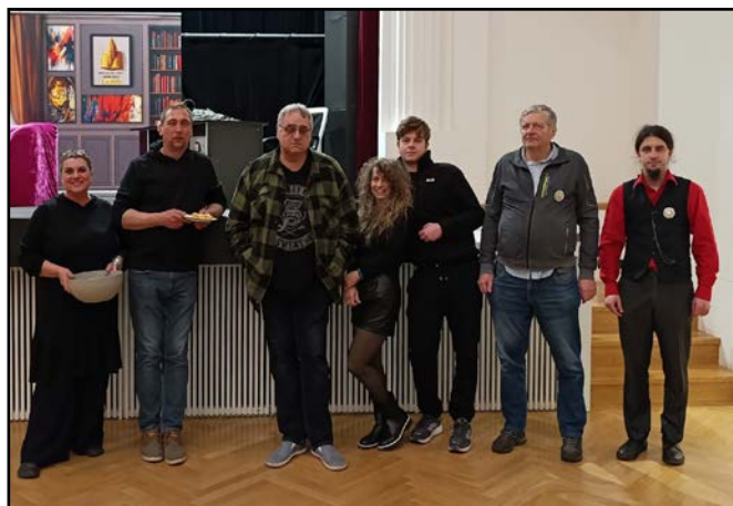
DS Osvětové besedy Velká Bystřice