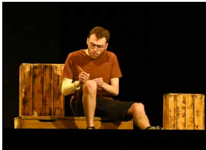
Recenzor v dalším čísle....