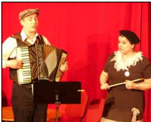
Kabaret La petit chat noir