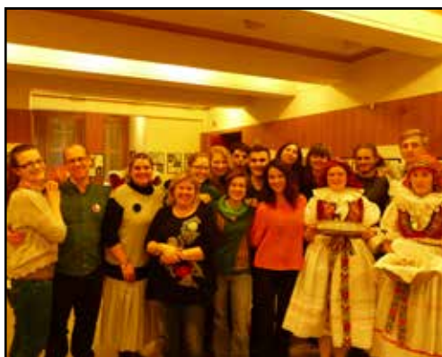
DS ASpol Brno Lužánky