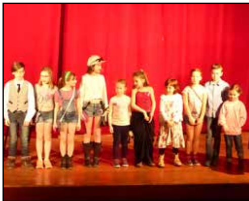
Mimoni z Kojetína