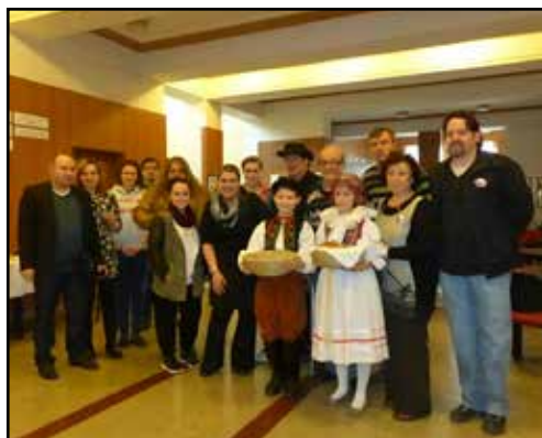
Blud v Týátru Bludov