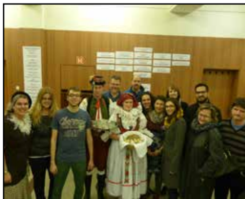
Divadlo Dostavník Přerov