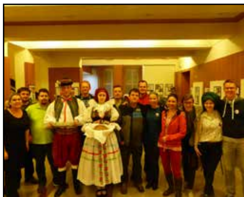
Divadlo Haná Vyškov