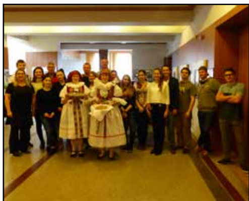
DS Horních Počernic Praha 9