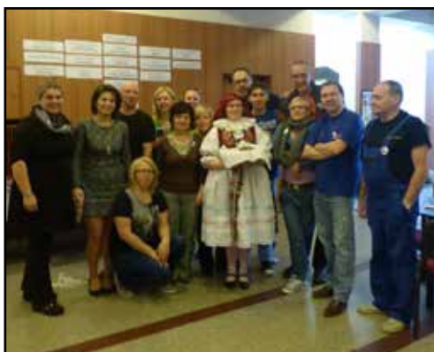
Lidové divadlo při MIKS Krnov