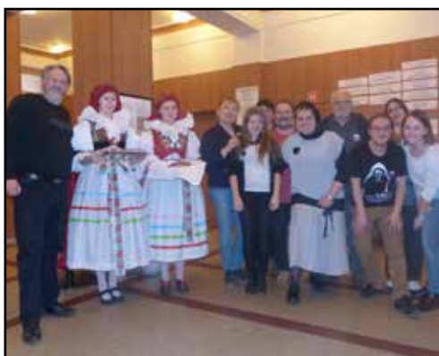
Divadelní spolek Kroměříž