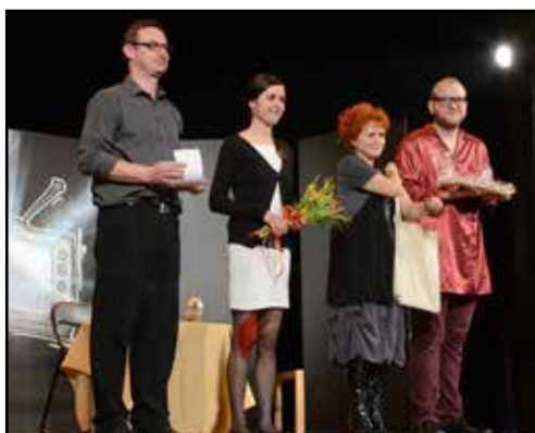
Hanácká scéna MĚKS Kojetín