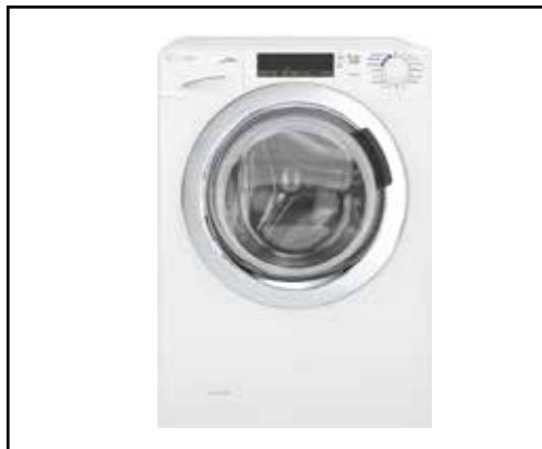
Nová pračka na kostýmy a obrusy