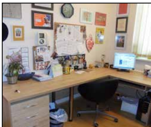
Nové nábytek u Svači v kancelu