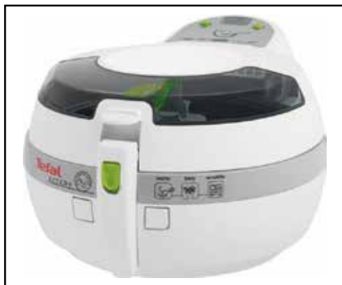
Nové otačecí hrnec na hranle