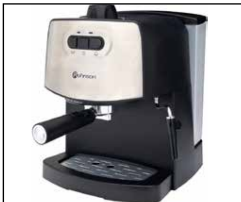
Nové presovač na presu