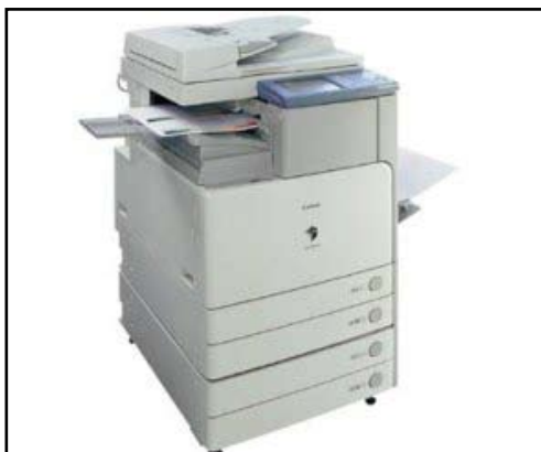
Nová barevná tiskárna (ne na Koječáka)