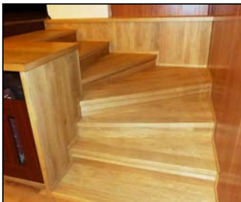
Nové schody na divadelní prkna