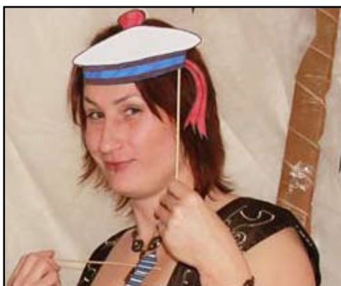
Nová kulturní i divadelní posila Zichy