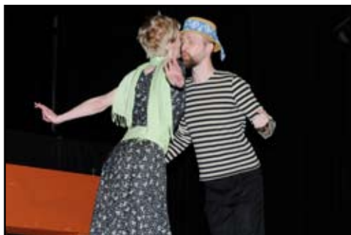
2. místo - Divadlo DiGoknu Rožnov pod Radhoštěm - Řeknu ti to v říjnu