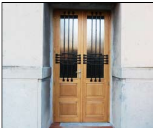
Nové dveře do divadla