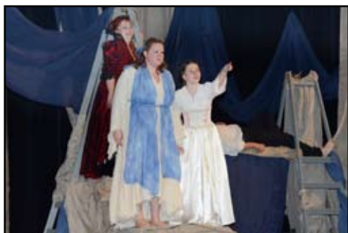
3. místo - Divadelní spolek Kroměříž - Slaměná židle