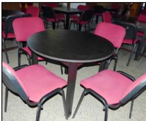
Nové kulaté stoly i na divadlo