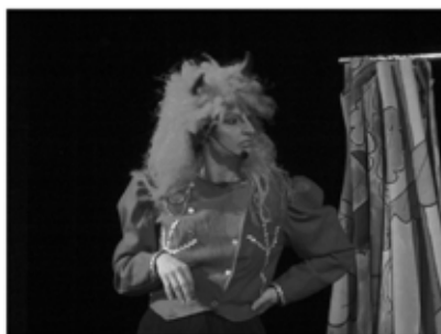
Jak princezna Máňa zachránila Martina z pekla