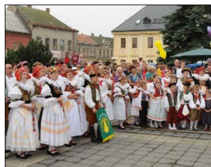
Hanáci na kojetínském náměstí