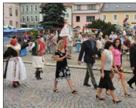
Před předáním hodového práva