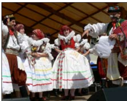
Hanácká beseda Kojetín