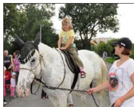
Jízda na ponících