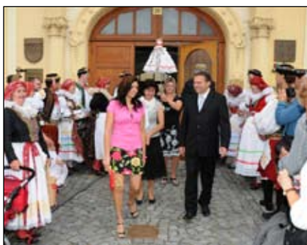
Vyzvání starosty k předání práva