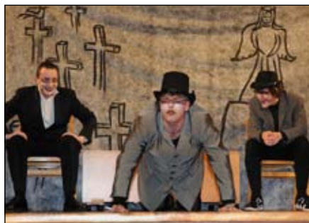
Pátek 18. března 2011

mu kolektivu v jejich další činnosti palce.