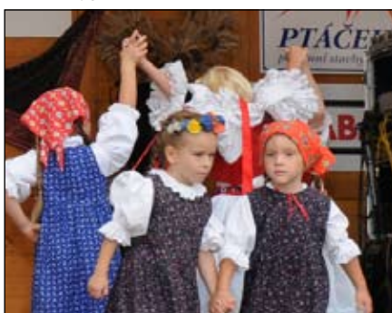
Pantlák Němčice n. H.