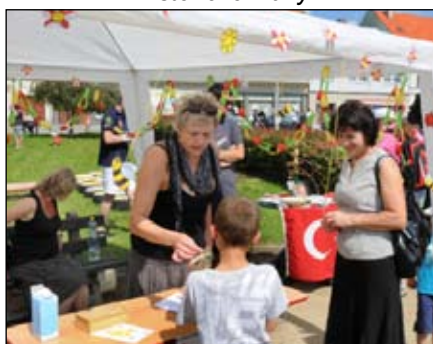
Hry a soutěže pro děti