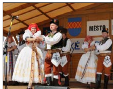
Kosiř Kostelec n. H.