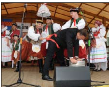
Vyplácení hříšníků „ferolů“