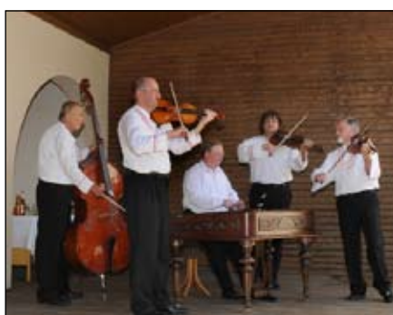
Cimbálová muzika Dubina