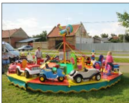
Atrakce pro děti

Návštěvníci kojetínských hodů mohli také navštívit nedaleký židovský hřbitov.