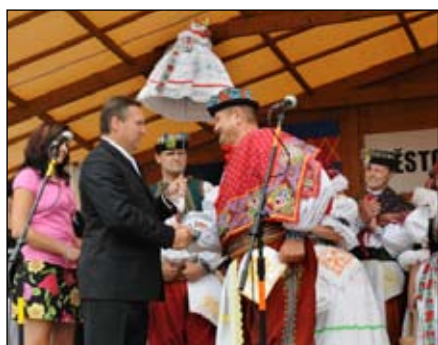
Předání hodového práva