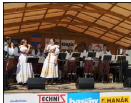
Dechová hudba Věrovanka