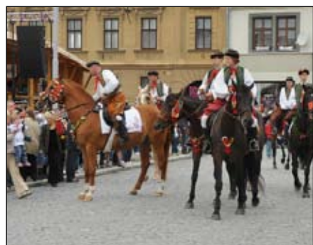
Ječmínková jízda králů