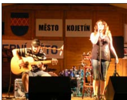
Painful Flower Tovačov/Přerov