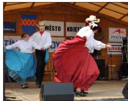
Lucky While Kojetín