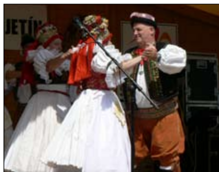
Hanácký sůbor Hruška