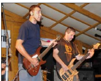
IQ Opice Kojetín