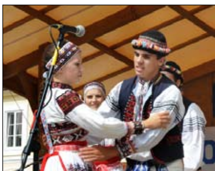
Kopaničár Starý Hrozenkov