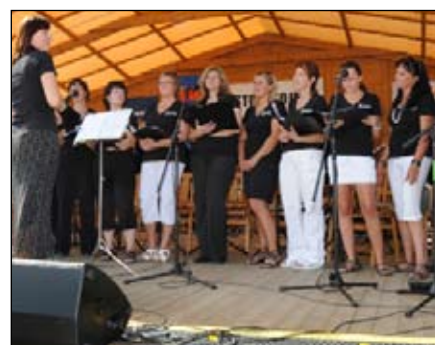
Pěvecký soubor Cantas Kojetín