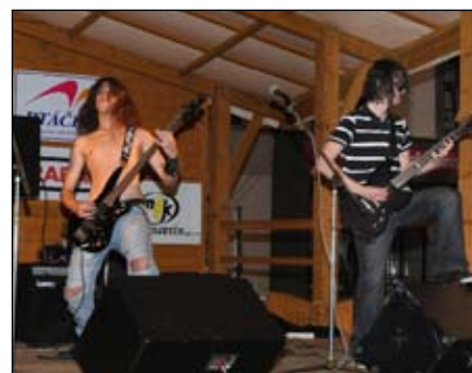
Crash Down Hulín