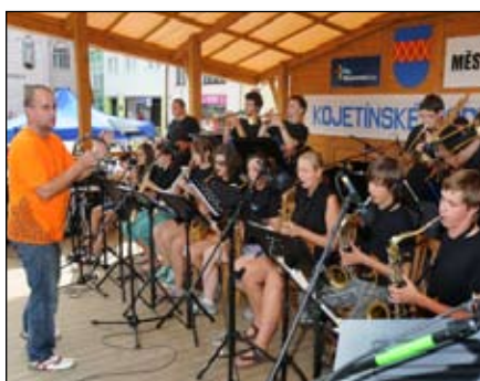
Leopardi Lipník n. B.