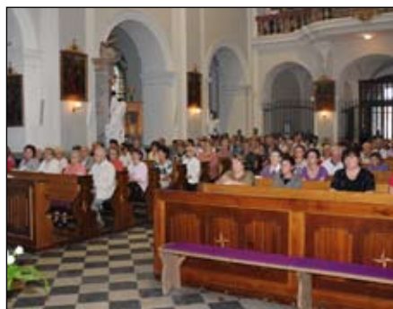
Slavnostní mše svatá