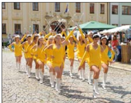
Mladší a starší mažoretky Šarm Kojetín

Tečku za kojetínskými hody udělala prostějovsko-kojetínsko-brněnská kapela Něco Mezi, která publikum roztancovala v rytmu ska.