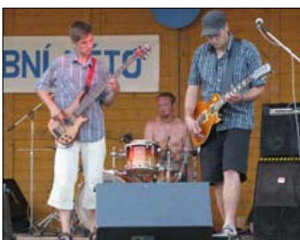
Veselá zhouba Kojetín/Prostějov