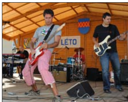
Zlatý voči Praha