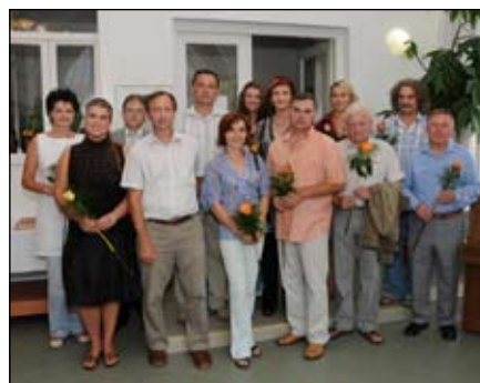
Vernisáž výstavy z děl členů tvůrčí skupiny Signál 64