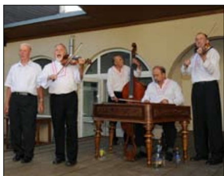
Cimbálová muzika Dubina