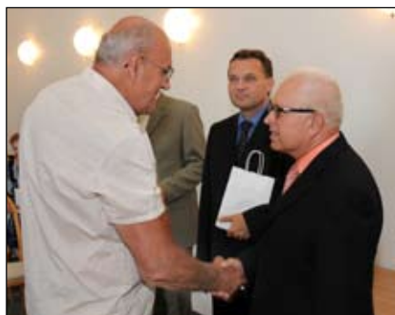
Setkání rodáků ročníku 1934