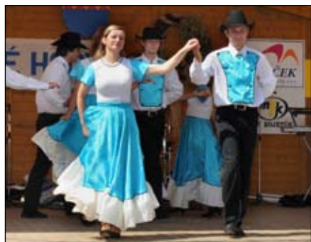
Lucky While Kojetín