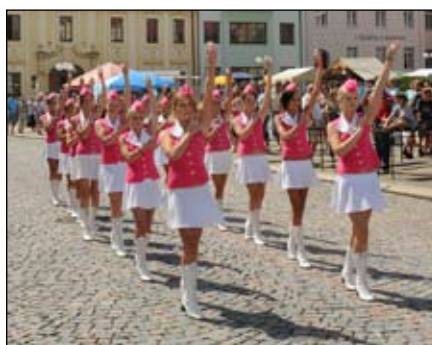
Mažoretky Šarm Kojetín