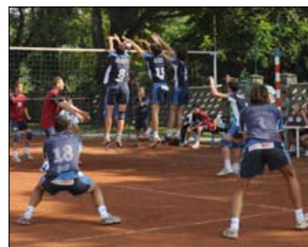
XXXII. ročník Turnaje Střední Moravy ve volejbale