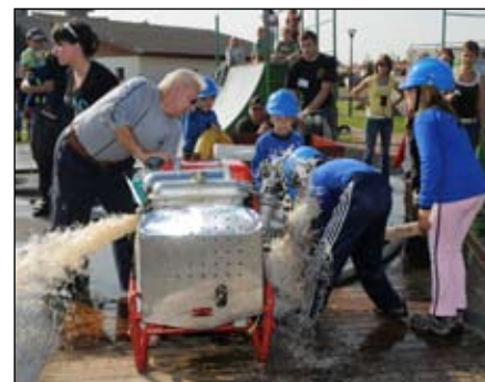
Soutěž mladých hasičů „O hodový koláč“

Sobotní IX. setkání harmonikářů v místní sokolovně, které nese jméno Vladimíra Pospíšila, zakladatele těchto populárních srazů, který bohužel loni zemřel, se setkalo s velkým zájmem jak ze strany vystupujících, tak i diváků. Letos se do Kojetína sjelo na čtyři desítky harmonikářů z celé Moravy i Slovenska, kteří soutěžili ve třech kategoriích dle typu harmoniky. O umístění jed-