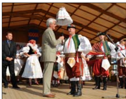
Předání hodového práva