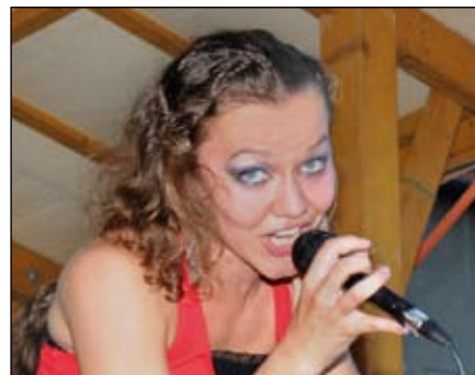
Koncert skupiny Nightwish revival Frýdek-Místek