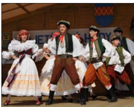
Přehlídka národopisných souborů