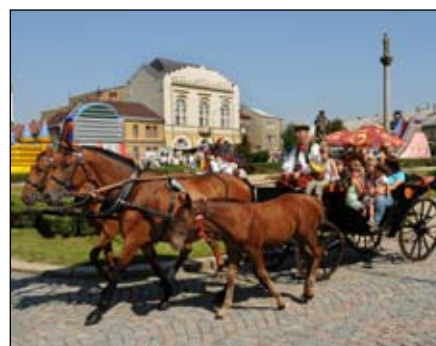
Kočár s koňským potahem