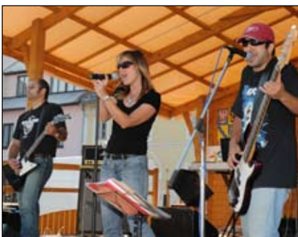
Guns N' Roses Uhřetčice