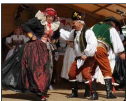
Přehlídka národopisných souborů