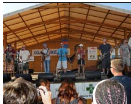
Koncert skupiny Děda Mládek Illegal Band