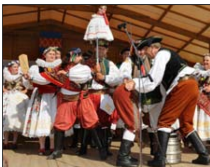
Vyplácení hřišníků „feroló“