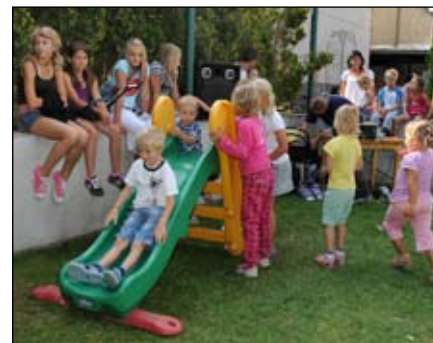
Dětská diskotéka, hry, soutěže a atrakce