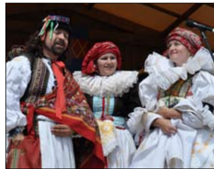
Hanácká svajba v podání domácí Hanácké besedy