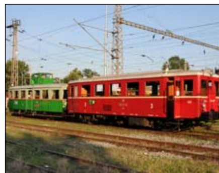
Provoz historických motorových vlaků