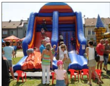
Atrakce, hry a soutěže pro děti

ve dvou vstupech předvedly i svá vystoupení. Na pódiu také vystoupila taneční country skupina Lucky While, breakdance Hollywood stars a skupina scénického šermu Cordiallo.