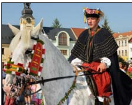
Ječmínková jízda králů