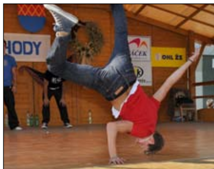
Hollywood stars Kojetín/Lipník