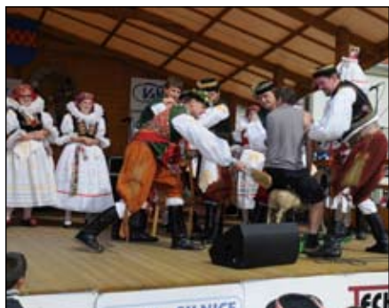
Vyplácení hříšníků „feroló“