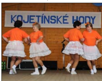
Klub seniorek Bochoř