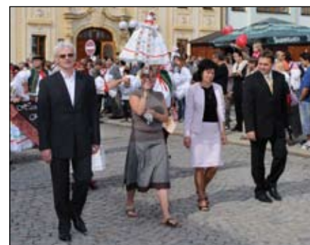
Předání hodového práva