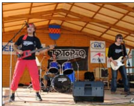
19. 8. 2008 Tip Top Kroměříž