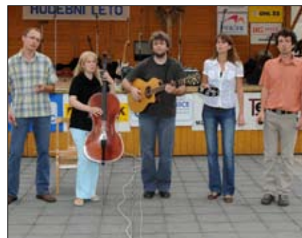
20. 8. 2008 Svítání Brno