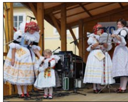
Pantlák Němčice n. H.