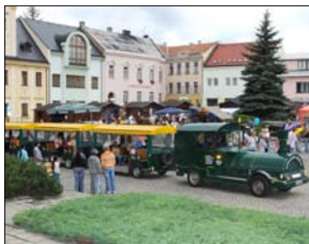
Atrakce pro děti