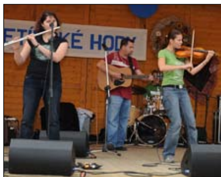
Celtic Cross Ostrava