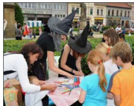
Hry a soutěže pro děti