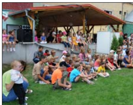
Dětská diskotéka s kouzelníkem