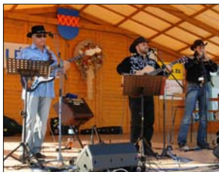
18. 8. 2008 Merylen Brno

Naopak páteční podvečerní hudební letní den patřil mladším posluchačům. Letos nám na náměstí namixovaly letní rockový koktejl tři regionální kapely - La Mancha ze Slavkova u Brna, IQ Opice z Kojetína a premiérově a zároveň i naposledy skupina My jsme China, kdo je víc z Kojetína.