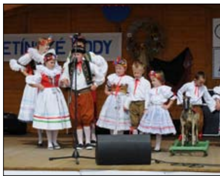
Sluníčko Kojetín a Šikulka Stříbrnice