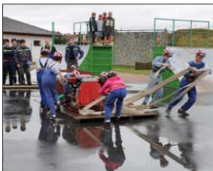
Závody mladých hasičů