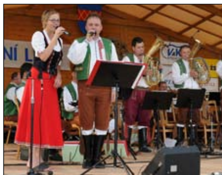
21. 8. 2008 Moravská Veselka Přerov