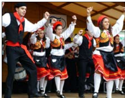
Zahraniční host z Portugalska