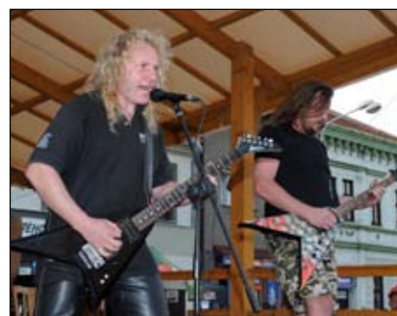
Revival Metallica Moravská Třebová