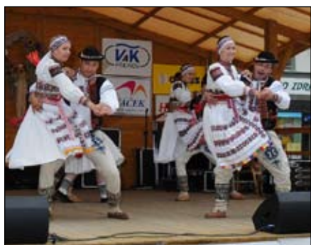
Kopaničár Starý Hrozenkov