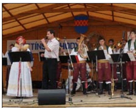
Dechová kapela Věrovanka