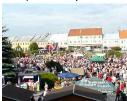
Zaplňené Masarykovo náměstí