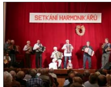
VIII. setkání harmonikářů

Počasí se postupně umoudřovalo a na nedělní hodové ráno se obloha vyjasnila. Hlavní hodový program mohl začít tradičně za slunečného počasí.