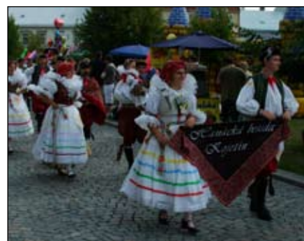
Hanácká beseda Kojetín