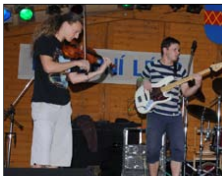
22. 8. 2008 LaMancha Slavkov u Brna, IQ Opice Kojetín, My jsme China, kdo je víc Kojetín