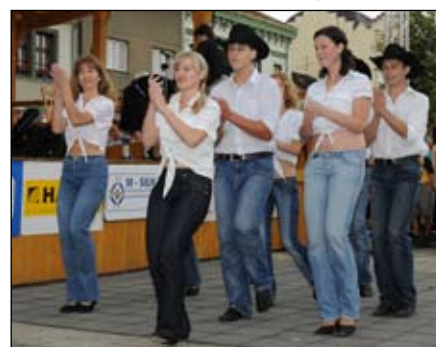
Lucky White Kojetín