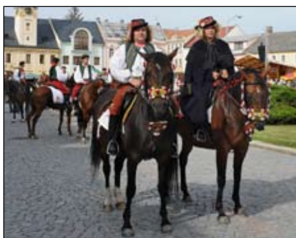
Ječmínkova jízda králů