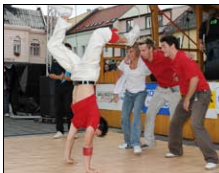
Hollywood stars Kojetín-Přerov