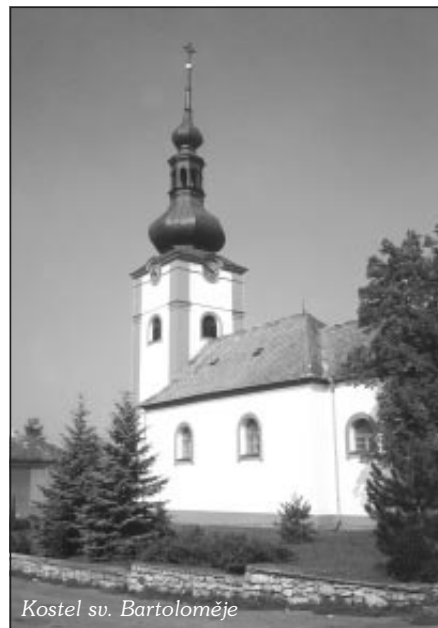
Kostel sv. Bartoloměje

Nedílnou součástí kulturního života v obci je knihovna, která je prostřednictvím městské knihovny Kojetín zásobena knihami podle potřeb občanů. Knihovnu navštěvují občané od školního věku po věk, kdy člověk potřebuje k životu knihu a čas. Moderním vybavením a