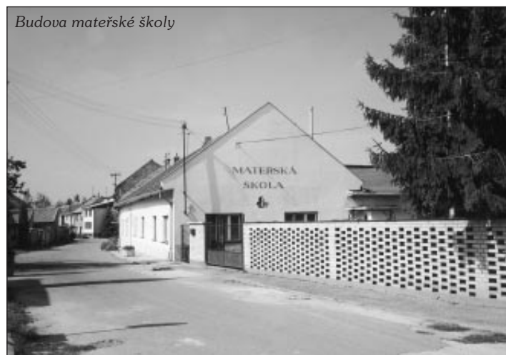
Budova mateřské školy