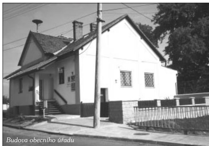
Budova obecního úřadu

Jak jsme již uvedli, nejvýznamnější památkou a domi-