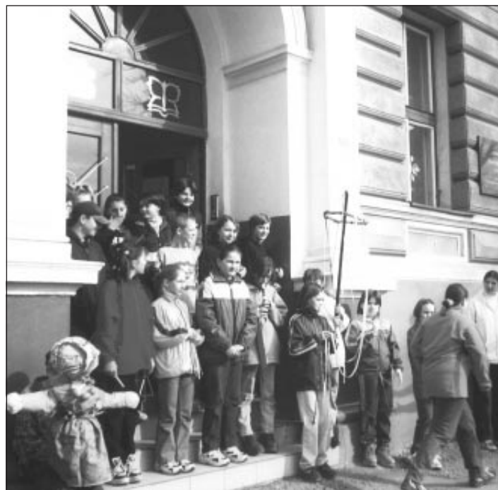
Žáci odnášejí „Zimu“ do řeky Moravy

Nedávno jsem četl v časopise ABC článek, ve kterém se uvádělo: „Plechová konzerva se vydrží v lese povalovat sto let, než ji za nás uklidí rez. Konzerva z hliníkového plechu bude krásit naše hvězdy ještě déle. Sáček z umělé hmoty se rozloží začátkem roku 2200. Nejvytrvalejší jsou skleněné lahve. Ve vykopávkách vědci objevili výrobky ze skla staré 4.000 let, takže o lahve odložené dnes, budou zakopávat naši potomci ještě za několik tisíc let.“