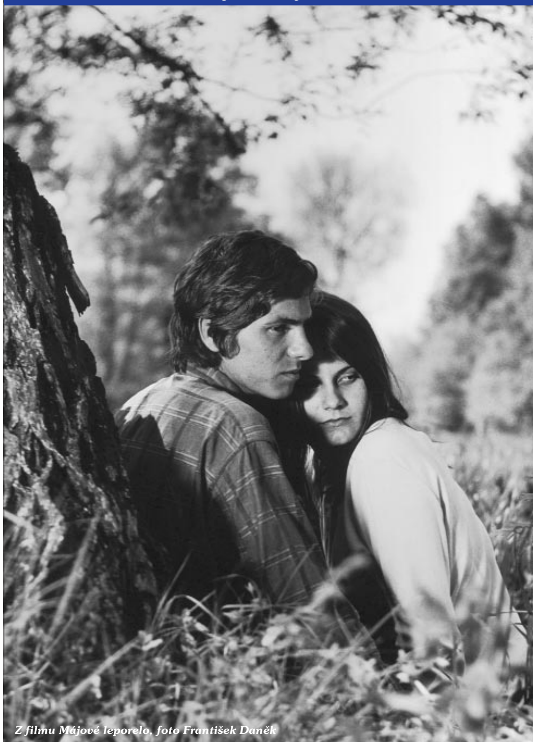
Z filmu Májové leoporelo