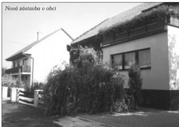
Nová zástavba v obci

Převážnou část podnikatelské činnosti tvoří soukromí zemědělci, kteří obhospodařují většinu orné půdy v katastru obce. Nejlepší půda v katastru obce dává dobré předpoklady k pěstování