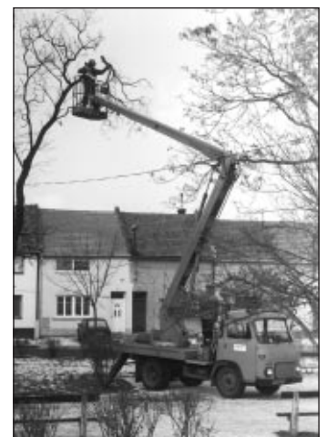
Pracovníci firmy Technis při zimní údržbě dřevin.

* zabezpečit majetek se kterým firma TECHNIS Kojetín hospodářsky proti zcizení.