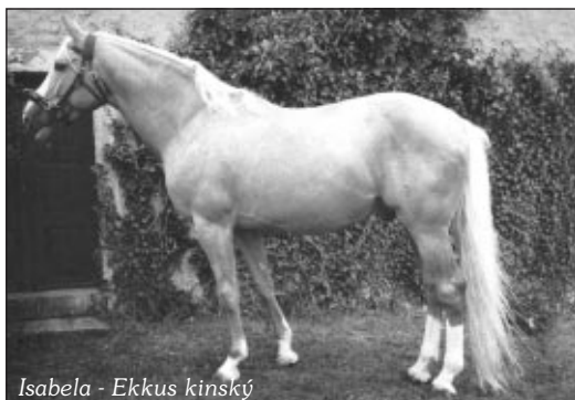
Isabela - Ekkus kinský