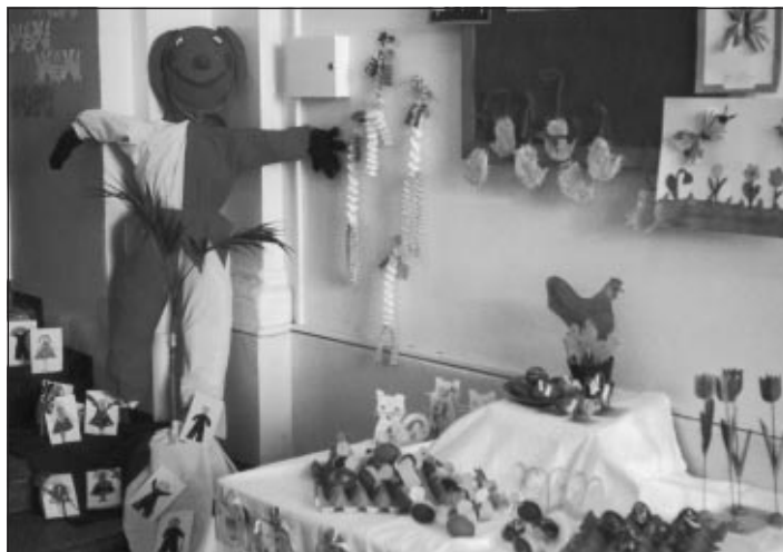
Jarní výstavka prací žáků školy