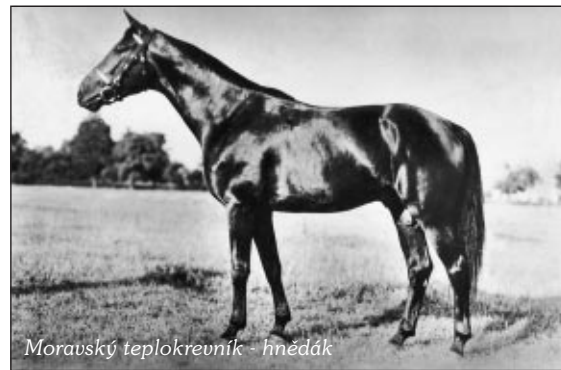
Moravský teplokrevník - hnědák

2. Starokladrubský kůň chovaný v národním hřebčíně Kladruby nad Labem, je chovaný v bílé barvě - bě-