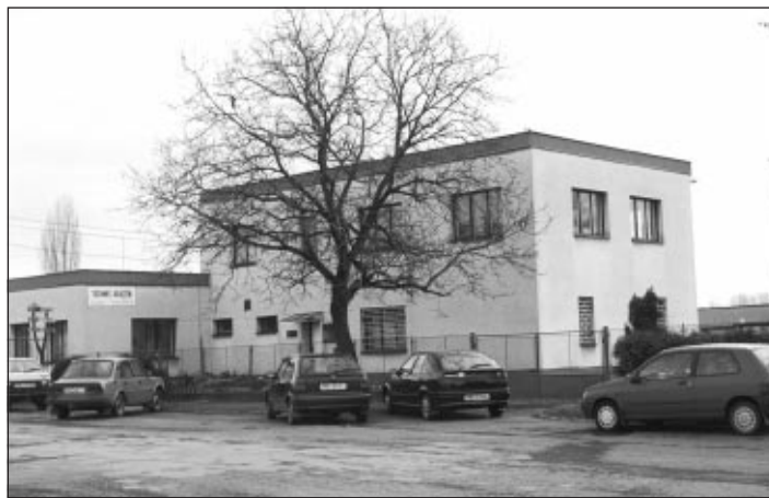
Správní budova firmy Technis Kojetín, spol. s r. o. v ulici Padlých hrdinů

Od 1.1.2000 jsme převzali tepelné hospodářství od Teplo Přerov, a.s. s cílem zachovat cenovou hladinu za vyrobené GJ a od 1.4.2000 budeme na území města Kojetína a místních částí zabezpečovat svoz komunálního odpadu. Tuto činnost přebíráme od firmy A.S.A. Brno. Dále v oblasti komunálních odpadů zpracováváme projekt na sběrný