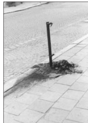
Tak dopadl odpadkový koš u holičství na Masarykově nám. v noci 18.3. 2000.