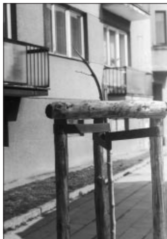
Zlomený strom na nám. Dr. Beneše.