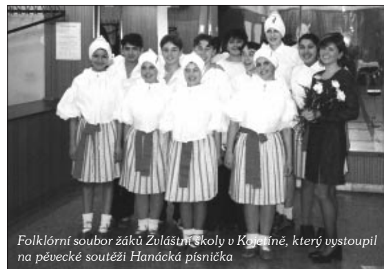
Folklorní soubor žáků Zvláštní školy v Kojetíně, který vystoupil na pěvecké soutěži Hanácká písnička

přicházet do distribuce. Musíme zajíždět do kin v sousedních městech či obcích (které jsou třeba menší než Kojetín). -řez-