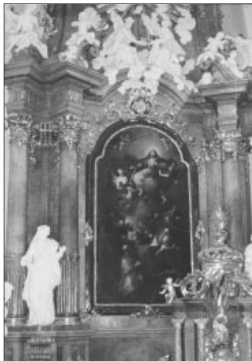
Obraz hlavního oltáře Nanebevzetí Panny Marie v Kojetíně.

Událostmi třicetileté války utrpěl také kojetínský kostel. Dne 3. července 1643 vyhořelo jak město tak také chrám. Ten byl poškozen nejen požárem, ale také střelbou. Zcela zničeny byly tři oltáře, dva stříbrné pozlacené kalichy, ciborium a monstrance. Dva ze tří zvonů byly