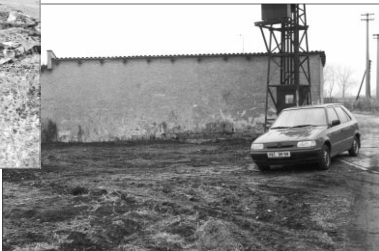
Tak vypadá toto místo po úklidu provedeném pracovníky Technisu s.r.o. Kojetín a kojetínskými skauty