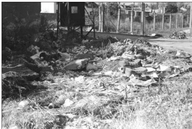
Ukázka vztahu některých občanů k životnímu prostředí – černá skládka u trafostanice na ulici Padlých hrdinů