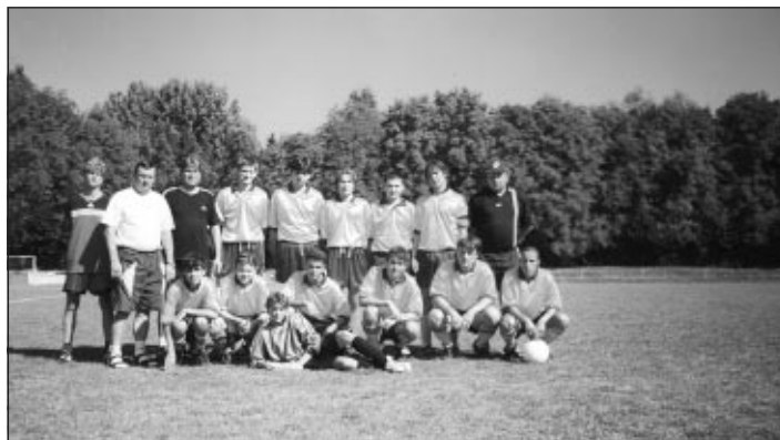
dorostenců v okresním přeboru.

Členskou základnu Slavoj tvoří přes 160 členů a je velmi sympatické, že více než polovina z nich jsou žáci a dorostenci. Ti snad skýtají naději, že mužstvo dosáhne za určitý čas takových výsledků, které by odpovídaly tradici kojetínského fotbalu a postoupí do vyšších soutěží. Podzimní část okresní soutěže, kterou hraje A družstvo mužů, skončila a toto družstvo v ní obsadilo 2. místo, mužstvo B je ze 14. účastníků okresní soutěže skupiny B na 12. místě, potěšitelná je 4. příčka