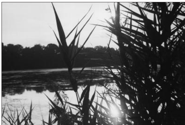
Významným krajinným prvkem Kojetínska je rybník Na Hrázi, romantický pohled při západu slunce nad rybníkem

gionu střední Haná. Tyto informace budou doplňovány fotografiemi přírodních zajímavostí, ale i míst, která člověk silně narušil a znehodnotil. Na přiložených fotografiích máte možnost porovnat a poznat taková místa ležící přímo v Kojetíně.