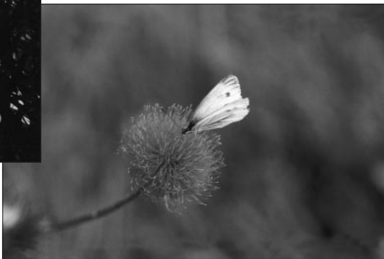
Zachovalou oblastí jsou také Včelínské louky, kde se vyskytuje řada druhů živočichů