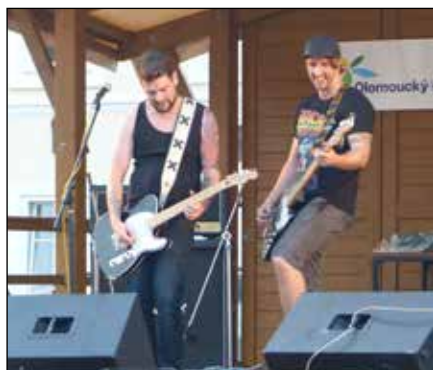
23. 8. 2019 - Rockový pátek USaPES / Praha