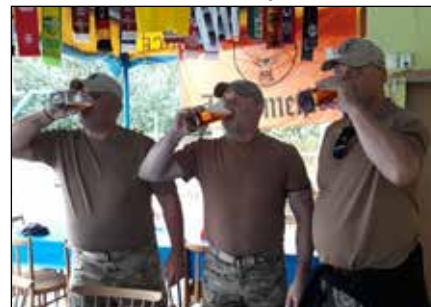
Kojetínská pivní míle