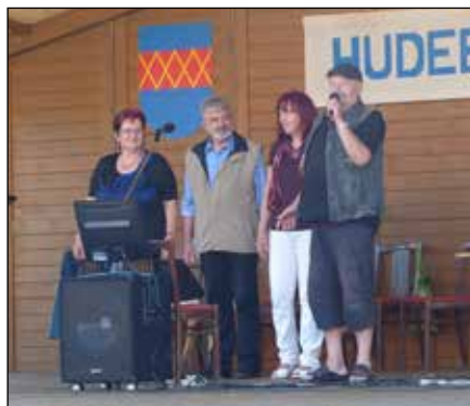
10. 7. 2019 - Hudba pro pamětníky Bývalí zpěváci a zpěvačky Diskant