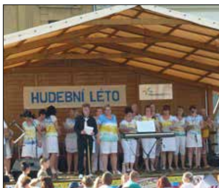
12. 6. 2019 - Cantas MěKS Kojetín ZUŠ a Prima nota GKJ