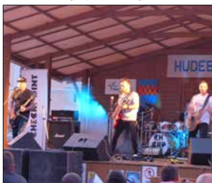
23. 8. 2019 - Rockový pátek Checkpoint / Praha