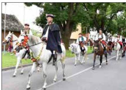
Ječmínková jízda králů