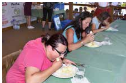
Soutěže v pojídání pukačů