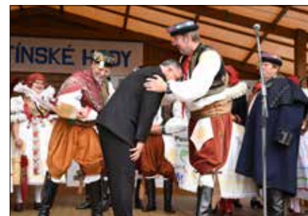
Vyplácení ferolů na gatě