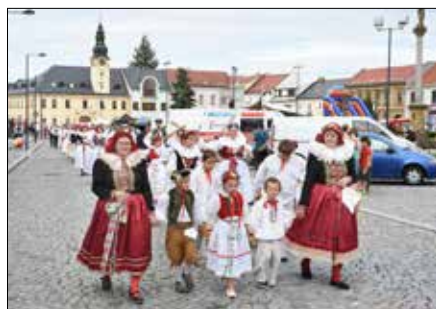
Krojovaný průvod městem

po ní následoval pop-folkový písničkář Voxel, který tak završil celé Kojetínské hody. Mimo hlavní program přispěla k slavnostní atmosféře hodů i řada doprovodných akcí jako veřejné prohlídky židovského hřbitova, otevření expozic Ztracená tvář Hané, Jízda králů na Hané a Strašidelného sklepení. Neméně zajímavé byly i veřejné prohlídky nové expozice v židovské synagoze nebo hodovní prohlídky Sokolovny. V sobotu i v neděli svázely přespolní návštěvníky historické vlaky na trati Kroměříž–Tovačov. V neděli dorazil dokonce autovláček, který vozil zájemce po Kojetíně. Oblíbenou letošní atrakcí byly také kolotoče, pouťové atrakce, stánky a nově pohádkové šapitó Divadla Koráb Brno, ve kterém mohli nejmenší spolu s kocourem v botách nebo Sindibádem prožívat nezvyklá dobrodružství. Letošní Kojetínské hody opravdu potvrdily to, že Kojetín je městem s širokým kulturním, sportovním a duchovním vyžitím a všem, kteří se do programu Kojetínských hodů připojili jakoukoliv měrou, patří velké poděkování.