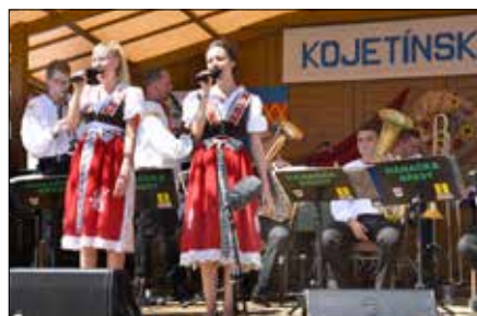
Dechová hudba Hanačka Břest