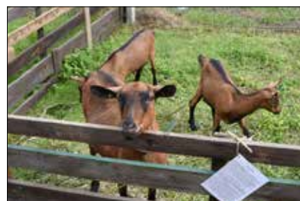
Výstava drobného zvířectva