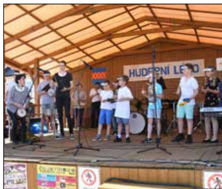
31. 5. 2019 - ZUŠ Open Základní umělecká škola Kojetín

Věříme, že hudební léto oslovilo co nejširší spektrum návštěvníků a každý si našel to své, co ho těší.