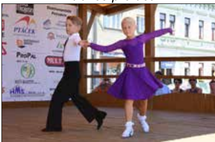
Taneční klub KST Swing Kojetín