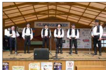
Mužácký sbor z Kněžpola