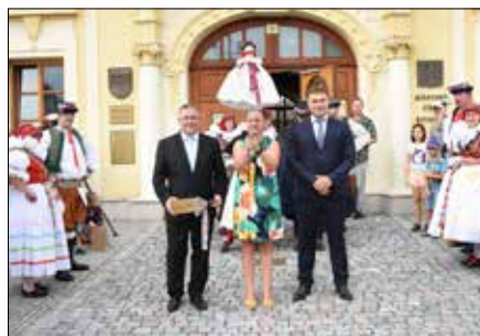
Předání hodového práva