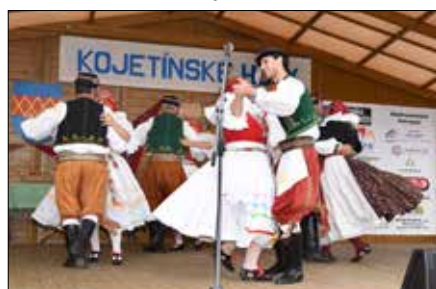
Hanácké sóbor Hruška