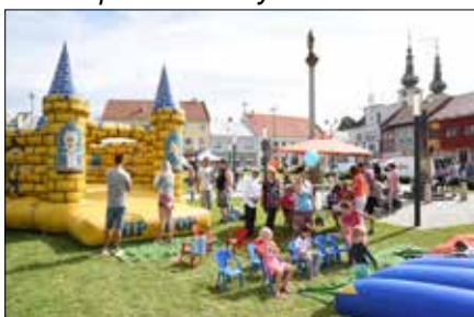
Atrakce pro děti