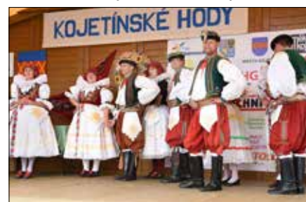
Hanácká beseda Kojetín