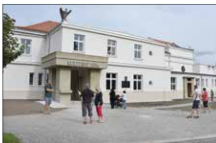
Den otevřených dveří Sokolovny