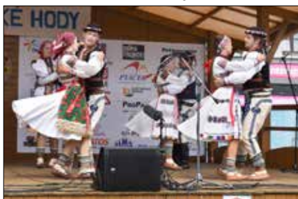
Kopaničár Starý Hrozenkov