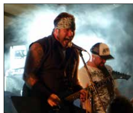
23. 8. 2019 - Rockový pátek Hanz's Fuckers / Hulín