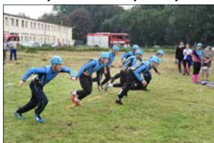
Hasičské závody „O hodový koláč“