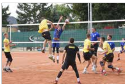
Turnaj Střední Moravy ve volejbalu