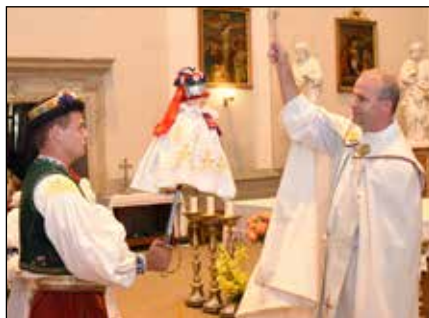
Žehnání hodového práva