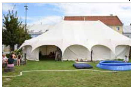
Pohádkové šapitó - Divadlo Koráb Brno