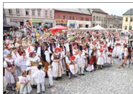
Národopisné soubory na náměstí