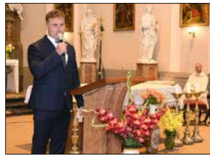
Slavnostní zahájení hodů