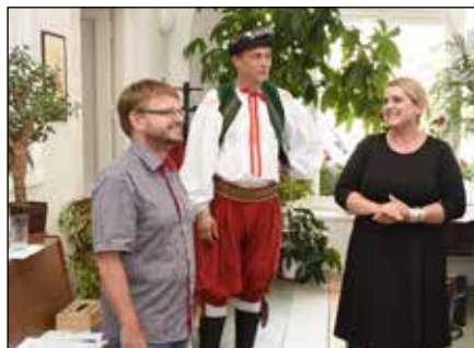
Výstava Jízda králů

tas. Souběžně probíhal v Kovalovicích a Kojetíně Pivní pochod aneb Kojetínská pivní míle. Samozřejmě zábava pokračovala i v hodový podvečer, kdy se na nádvoří VIC konal 7. ročník Kojetínské kytary, a v Hospůdce U Pedyho večer s hudbou.