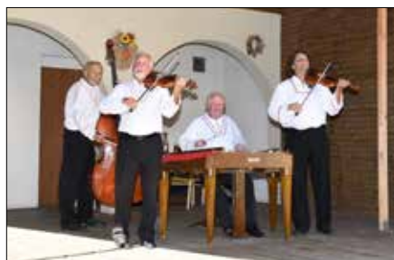
Cimbálová muzika Dubina